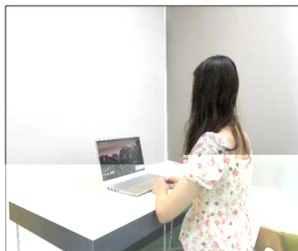
图3：侧后方第二机位效果图